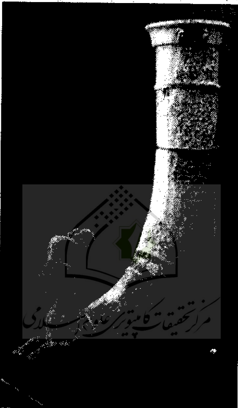
ریتون به شکل ظرف با حیوانی شاخدار مربوط به دوره پارسی

حفریات باستانشناسی همدان کشف شد. از آنجا که تا قبل از دوره هخامنشی اغلب از ریتون در مراسم نیایشی، تدفین و آیین‌های مذهبی استفاده می‌شد. در این دوره ریتون با شیوه و سبک درباری متجلی گردید. هنر ریتون‌سازی در این زمان باشکوه‌ترین هنر پیش از تاریخ به حساب می‌آید. قواعد و تصویر آفرینی با دقت و ظرافت تدوین شد. هنرمند هخامنشی از طلا و نقره، شیشه و سنگ‌های معدنی و زر ریتون‌های تحسین برانگیز آفرید. سلطنت سلوکیان در مرزهای غربی آن به دریای مدیترانه می‌زیسید و به مرزهای شرقی آن در رودخانه «گیداسپ» در شمال «هند» می‌پیوست. هنر به موازات گسترش موضوع و زمینه‌ها متنوع و با حرکت پویای خاص به وجود آمد.